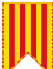
Exemple de la bandera encomanada pel Mestre Racional.

Durant tota l'Edat Moderna, en què el nostre País roman amb Furs propis, mai es va crear una bandera pel territori valencià. No es va crear mai perquè a l'època els territoris no tenien banderes pròpies, solament en tenien els reis, els nobles o les ciutats. A l'Edat Mitjana les viles reials seguien les quatre barres roges sobre fons groc, símbol de la monarquia. Els senyorius tenien per bandera pròpia la creu de Sant Jordi, estendard de la noblesa. La ciutat de València tenia el privilegi de poder seguir bandera pròpia, que va ser la que figura a dalt, amb modificacions en cada època. La bandera s'hissava a les Torres dels Serrans.