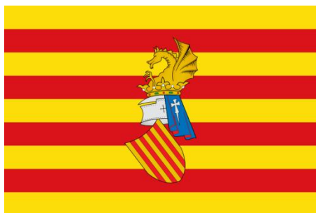
Bandera del Consell Pre-autonòmic amb l'escut del Consell sobre la Senyera històrica del País Valencià.