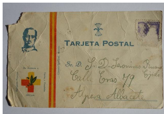
Una de les postals que formen part de dels papers de la capsa

Es tracta d'un conjunt de papers que, per casualitat, em vaig adonar que existien. Tots ells eren documents històrics 1 de diversos tipus: cartes, documents de propietat, assegurances... La majoria es trobaven en un estat de conservació prou bo gràcies a la protecció de la capsa metàl·lica en la que van romandre, ja que d'altra manera hagueren quedat malmesos perquè es trobaven a un terrat, exposats a