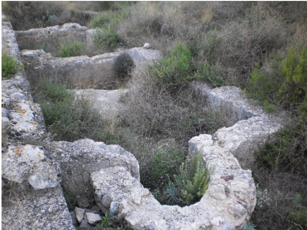
Restes de les vivendes i l'aljub. Fotografia Bañuls Escrivà 2010.