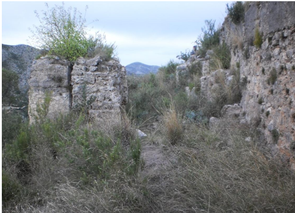
Entrada al castell. Fotografia Bañuls Escrivà 2010.