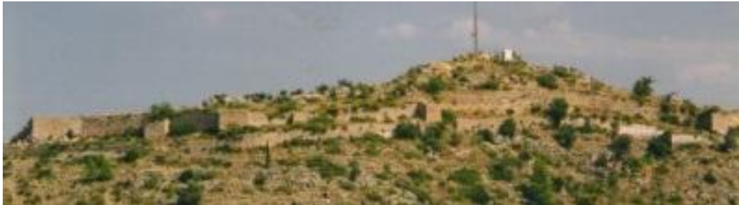
Vista del castell

defenses construïdes en el seu flanc més accessible, és a dir, al migdia, atés que la seua cara nord presenta un escarpament de gran desnivell i inaccessible, que delimita amb la Vall de Pego.