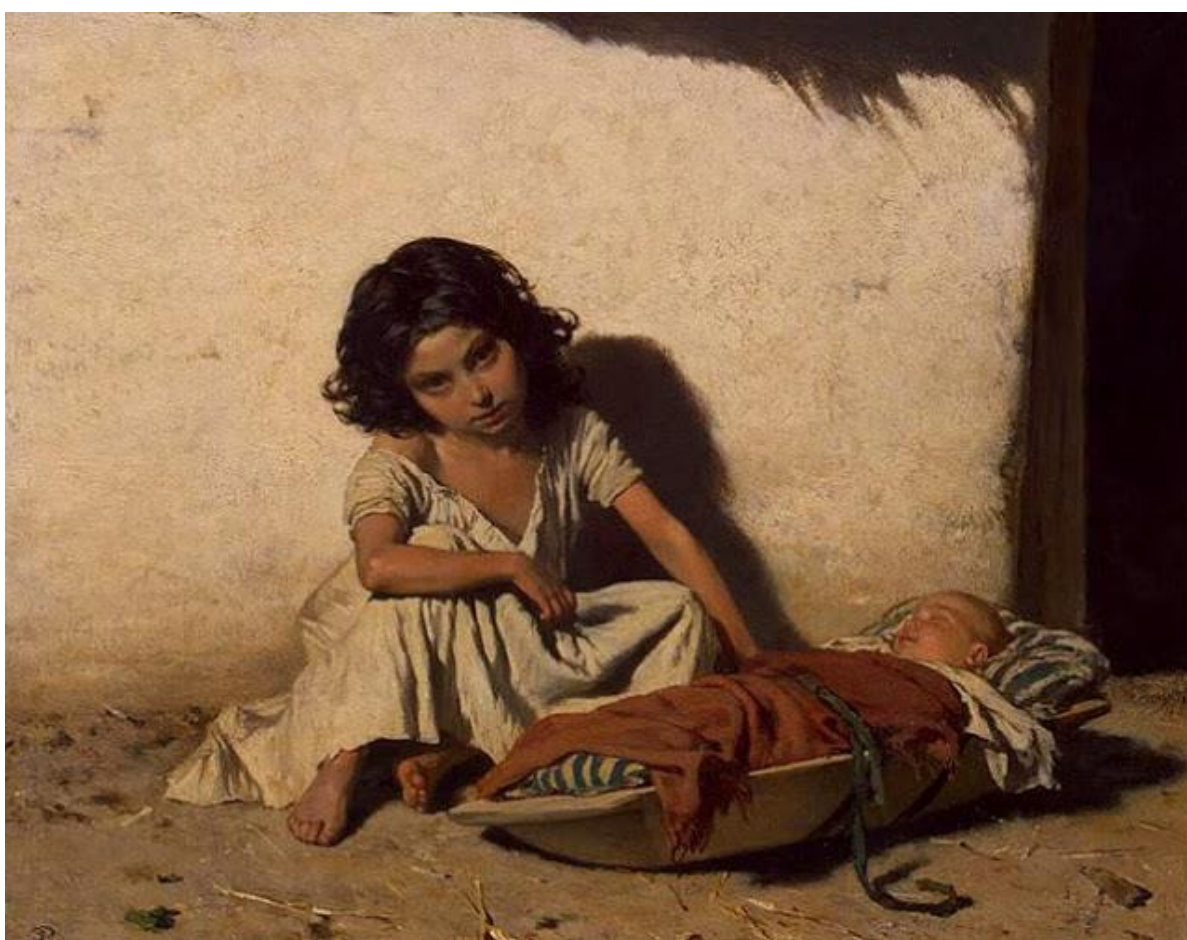
Els xiquets gitanos, August Von Pettenkofen, Museu de l'Hermitage

gitanos. Les repetides mesures contra aquesta ètnia, i sobretot les referents a la seua expulsió, només tingueren una eficàcia limitada, i passat un temps, les famílies gitanes tornaven a recórrer el territori valencià, així com passava a altres indrets de la Península. A partir de la documentació que estudia dit autor podem veure les acusacions que es repeteixen sobre els delictes dels gitanos a València, que van des de robatoris a la blasfèmia, i que sempre estan relacionats amb el seu caràcter nòmada, de "gentes de mal vivir, ociosas, vagabundas e incontroladas, atávicamente predisuestas a dañar". 8