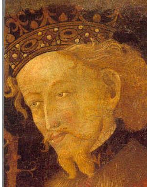
Retrat de Jaume I pintat el 1427, actualment al Museu Nacional d'Art de Catalunya.

El 12 de setembre de 1213, a la famosa batalla de Muret, cau mort en combat Pere II i, consegüentment, es produí la victòria dels croats. Començà, llavors, un procés de cloenda de tot allò que havia florit a Occitània. Mentre, a la Corona d'Aragó tenien com a rei un infant de cinc anys (Jaume I "el conqueridor"), retingut, però, pel cap dels croats Simó de Montfort. La Corona d'Aragó es trobava en aquest just moment en una situació delicada d'instabilitat política. El rei es trobava a mans de Montfort, fet que sacsejà la corona durant anys i en provocà