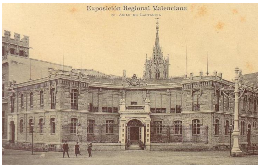
Figura 3. Asil de Lactancia de València.

L'edifici va estar acabat al 1909, però no va entrar en funcionament fins el 14 de juny de 1914, ja que la Companyia Arrendatària de Tabacs havia cedit l'edifici a l'Ateneu Mercantil de València per tal de que formara part de l'Exposició Regional de 1909 com a Palau de la Indústria. 13 Però no sols es tractava de cedir l'edifici per a usar-lo a l'Exposició sinó que, a canvi de cedir-lo, es comprometien a construir un nou Asil de Lactància en els terrenys adjacents.