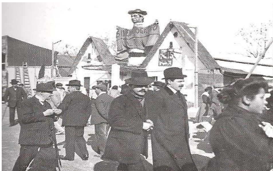
Imatge de la Fira de San Jaume a la Plaça Emili Castelar 14