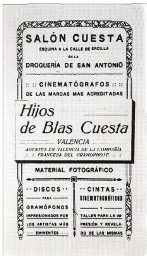
Imatge que anuncia el Saló Cuesta 22

El seu començament fou amb la realització de pel·lícules per anunciar els seus productes, però prompte rodaran una pel·lícula sobre el Tribunal de les Aigües, la qual aconseguí tan gran èxit que aquesta família decidí introduir-se en la producció de pel·lícules baix el nom de "Films Cuesta", i que es dedicà a produir pel·lícules de caràcter anecdòtic sobretot, documentals taurins. 23 La producció de documentals li permetia una fàcil explotació i podia proporcionar encàrrec a l'empresa, a més de ser distribuïts per l'Estat espanyol o l'estranger.