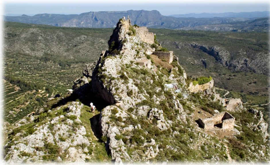
El Castell d'Alcalà o Benissili fou el principal bastió d'al-Azraq i on va establir la seua residència.

El 21 de maig de 1258 Jaume I ja es trobava instal·lat a Cocentaina, on esperava congregar la host abans de dirigir-se a les muntanyes. El dia 31 del mateix mes va partir cap a Alcalà, principal bastió d'al-Azraq, des d'on el cabdill musulmà va fugir per a buscar la protecció del castell de Gallinera. Després de huit dies de setge, el castell d'Alcalà va rebre l'ordre de rendir-se. Al-Azraq era obligat a abandonar el regne de València. 11