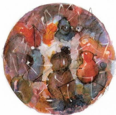
Nyítols. Il·lustració de Francesc Santana. Victor Labrado, 2007, pàg 23.

del cervell. Es podien endur tots els records d'un individu i solien atacar als qui dormien al ras. 15 Les maldats dels nyítols han donat origen a la frase feta "et trauré els nyítols", en sentit d'amenaça.