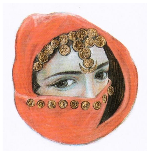
Encantada. Il·lustració de Francesc Santana. Víctor Labrado, 2007, pàg 101.

Altre exemple el trobem a l'encantada del Barranc de l'Encantà a Planes, on es diu que sota les aigües del riu es troba el palau de la princesa que guarda el tresor. Aquesta sols apareix una vegada cada cent anys. Si tenim sort i se'ns apareix una nit amb un cofre d'or, ens preguntarà: "Que t'estimes més, el tresor o jo? Tot no pot ser". Si l'home s'estimara més el seu amor es desfaria l'encantament i ella seria lliure per sempre, però es presenta amb tantes riqueses que ningú l'ha preferida. 9 En altres casos no es troben soles, sinó que estan acompanyades d'un guàrdia, una serp monstruosa o un ogre bru que cal vèncer per a alliberar-les.