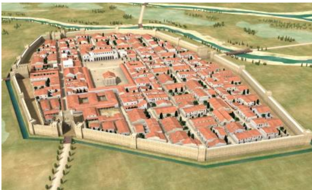
Reconstrucció de la ciutat d'època republicana (Escrivà, Ribera i Vioque 2010).

Una vegada tenien als déus del seu costat, es procedia a repartir el territori entre els colons i s'iniciaven les obres de construcció en un procés molt lent. En primer lloc s'instal·laven en tendes, després construïen cases provisionals de fang, i finalment edificaven el recinte emmurallat i les grans construccions de pedra.