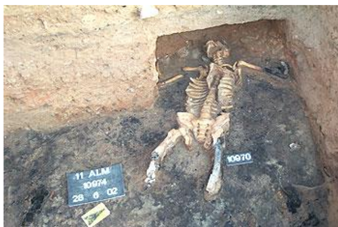
Restes humanes trobades al Fòrum (Escrivà, Ribera i Vioque 2010).

A l'Almoina es van trobar unes restes humanes que ens mostren l'execució dels presoners del bàndol vençut. Hi ha 14 cosos masculins, en edat militar, assassinats i esquarterats, trobats al Fòrum. Fins i tot s'ha trobat un cos empalat amb un pilum (llança). En acabar la matança es va incendiar la ciutat. Per aquest motiu s'han trobat els enderrocats dels edificis sense remodelacions posteriors, amb la qual cosa s'ha pogut fer una bona reconstrucció