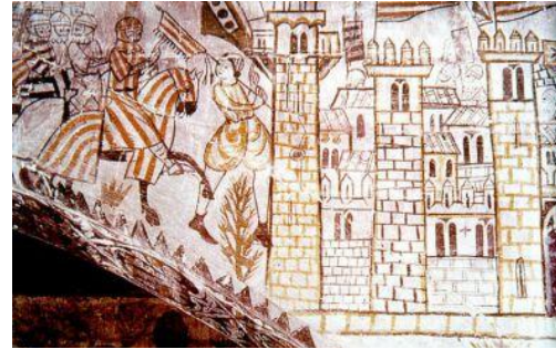
Mural del s. XIV al castell d'Alcanyís que representa l'entrada de Jaume I a València en 1238.

Així mateix, els èxits militars del s. XIII a Mallorca i al País València intensificaren el comerç dels mercaders genovesos: d'una banda per l'aprovisionament dels exèrcits durant les campanyes militars i pels botins de guerra, i d'altra per l'arribada dels nous repobladors. 8 El s. XIII es mostra com un període d'arribada de nous habitants a les nostres terres, entre ells colònies de genovesos, ja que tant l'illa de Mallorca com el País València passaren a ser escales de gran importància del comerç genovès cap al nord d'Àfrica, els territoris musulmans i cap a Sevilla.