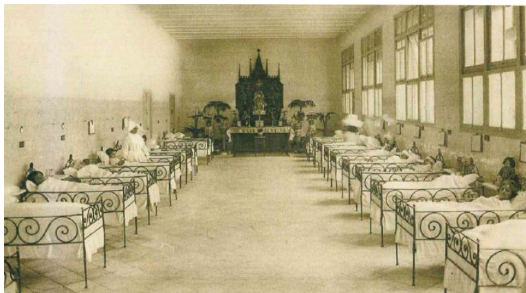
Sala dels xiquets.

A més de tots aquests canvis, es produeix una reforma important. En 1849, l'Hospital General, els seus reglaments i funcions passen a estar al càrrec de l'administració de la Diputació Provincial. A més, l'hospital canvia el seu nom i passa a anomenar-se "Hospital Provincial". Es compleix així l'ordre de Govern que disposava que els centres i asils que fins aquell moment estaven al càrrec de l'Ajuntament restaren baix la inspecció i vigilància de les Juntes Municipals de Beneficència.