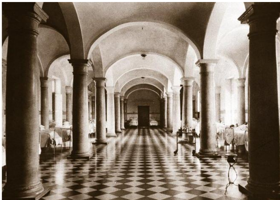
Imatge de l'interior de l'Hospital General (1927).

No solament hi havia diferents edificis segons la finalitat, sinó que també se separava als malalts segons el seu sexe: els homes es trobaven situats al primer pis, i les dones al segon 8 .