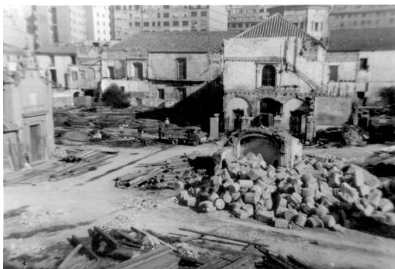
Demolició de l'Hospital General als anys 60

No fou fins al 1931 quan es projecta la construcció del nou Hospital General. Tot i així, les obres no comencen fins al 1946, finalitzant-se al desembre de 1962, moment en què s'inaugurà l'actual Hospital General en l'Avinguda del Cid. L'antic Hospital General arriba al seu final amb l'enderrocament del recinte hospitalari en l'any 1962, deixant únicament part d'una de les infermeries, que des del 1979 és la Biblioteca Pública de València, l'ermita de Santa Llúcia i la capella del Capitulet.