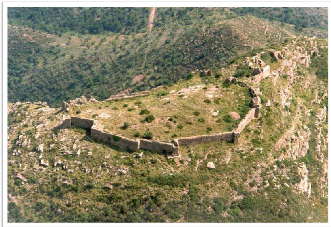
Fotografia del Castell de La Vall d'Uixó

Altres qüestions que es reflecteixen en aquesta publicació 2 , són l'operació sobre Nules i Mascarell i l'última operació en Llevant: el castell d'Uixó, on les tropes franquistes intentaren l'assalt fins que ho aconseguiren, arribant a la cima del castell amb superioritat numèrica. El següent pas seria la caiguda de la ciutat de la Vall d'Uixó. Eren temps de retrocés, l'exèrcit republicà a Catalunya estava en retirada i la fi del conflicte era més que clar.