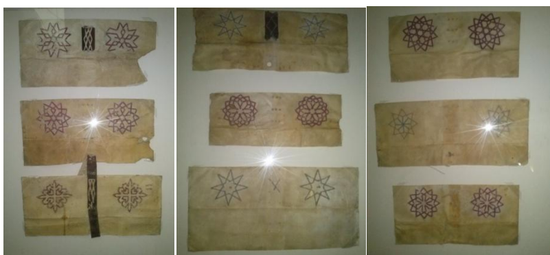
Decoració mudèjar sobre pergamins exposada a l'entrada de l'Arxiu de la Catedral de València.

El material de què es componen aquests còdexs de caràcter administratiu és el paper i es troben enquadrats amb pergamí, en la majoria dels casos reutilitzat. Les seues cobertes presenten una decoració pobra i senzilla amb motius que recorden l'art mudèjar. 7