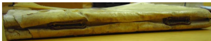
Portada i detalls de l'enquadernació d'un llibre de fàbrica; li manca la decoració mudèjar.

Actualment per què es construeix i com es construeix són dos qüestions elementals en qualsevol investigació de caràcter general sobre una catedral de l'edat mitjana. En aquest sentit els llibres de fàbrica són una font documental bàsica per aprofundir en les raons de la construcció, el seu finançament o la materialització del treball a peu d'obra.