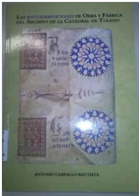
Portada del llibre: CARPALLO BAUTISTA, A., Las encuadernaciones de Obra y Fábrica del Archivo de la Catedral de Toledo , Cabildo Primado: Instituto Teológico San Ildefonso: Diputación Provincial, Toledo, 2010.

Cal assenyalar que l'antiguitat d'aquestes sèries varien segons cada arxiu capitular, ara bé la majoria d'elles s'inicia al s. XIV, sent la sèrie de fàbrica de la catedral de València de les més antigues.