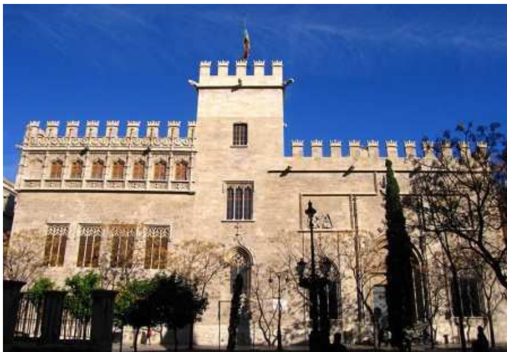
Façana de la Llotja.

Pel que fa al simbolisme de la construcció, cal assenyalar les representacions heràldiques de la Ciutat de València, amb un alt contingut simbòlic i visibles des del primer moment de la construcció. Es tracta d'un total de quatre escuts de la ciutat de València: dos són de grans dimensions i es troben situats als angles sud-est i sud-oest de l'edifici; els altres dos presenten unes dimensions més reduïdes i es troben als angles nord-est i nord-oest. Dels 4 escuts, cal destacar l'escut situat a l'angle sud-oest, que dona al Mercat Central i que compta amb dos àngels subjectant l'escut 11 .