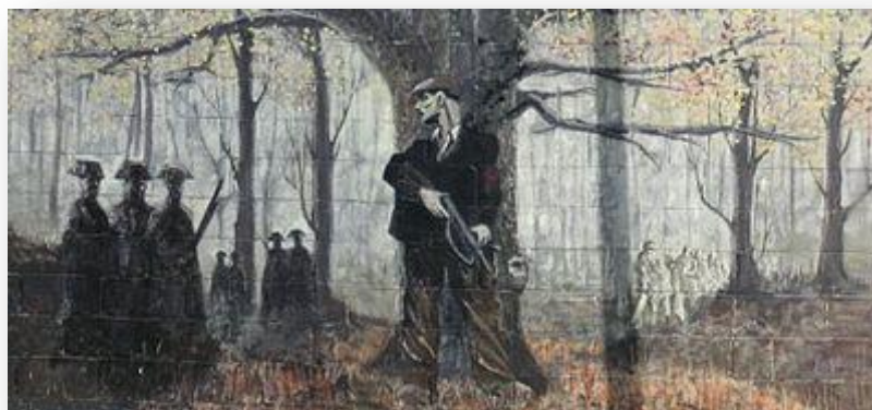
Graffiti en un mur de Sallent