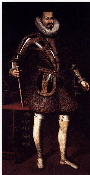
Francisco Gómez de Sandoval y Rojas, V marqués de Dénia. Pintura de Pedro Pablo Rubens, 1603

La figura d'aquest marquès, per tant, fou important tant en el marquesat com en el context de la monarquia. Els seus anys de menor fortuna sempre residí en el marquesat, però en els temps de major auge en la cort reial, les seues visites foren puntuals i cada vegada més esporàdiques fins els últims anys de la seua vida, en els que s'establí a Valladolid. És un de tants nobles que destaquen pel seu absentisme en aquesta època. Així, durant la seua absència, les figures del procurador general o del batle, nomenats pel marquès, el representaven. No obstant, és innegable la quantitat de favors que aquest marquès atorgà als territoris del seu marquesat.