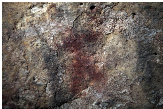
Fig 4. Pintura esquemàtica de la cova. Antropomorfa amb les extremitats esteses.

Però la Cova de la Sarsa no ens ha deixat de sorprendre des del moment del seu descobriment com quan l'any 2005 es trobaren pintures rupestres. És tracta d'una troballa molt important dins de la discussió sobre la funcionalitat de la cova. La pintura es troba en una de les sales interiors. Totes les pintures documentades fins el moment es