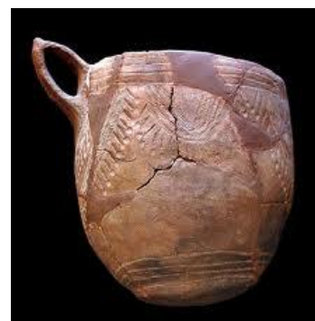
Fig 3. Vas de ceràmica campaniforme de la Cova de la Sarsa.

La Cova de La Sarsa es caracteritza com ja hem dit per un gran desenvolupament de la ceràmica decorada. Ressalta la ceràmica impresa cardial, la de cordons i relleus i, en menor mesura, les incises acanalades, pentinades i en menor mesura les esgrafiades i les pintades. És una indústria ceràmica feta a mà de bona qualitat, amb pastes acurades i superfícies tractades ( allisades o brunyides). Les formes més presents són les olles, canters-ànforoides, vasos tronònics, en molts casos vasos de grans