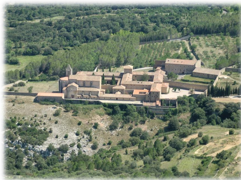
Vista del Monestir de Santa Maria de Benifassà.

En l'actualitat, el Monestir de Santa Maria de Benifassà, situat al terme municipal del principal nucli de Benifassà, la Pobla de Benifassà, continua sent un centre monàstic, no cistercenc sinó cartoixà, encara que desvirtuat pel pas del temps.