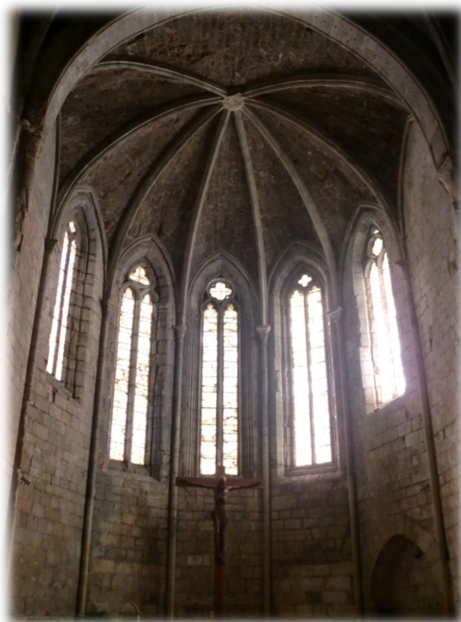
Església del Monestir. Foto de Júlia Jordà

La Guerra del Francès, les successives desamortitzacions del segle XIX i la Guerra Civil espanyola han provocat l'enderrocament de gran part de les estances primigènies, i de les quals només en resta actualment l'Església, l'únic lloc visitable hui en dia. 3 La resta de les edificacions han estat reconstruïdes després de la fi de la Guerra Civil.