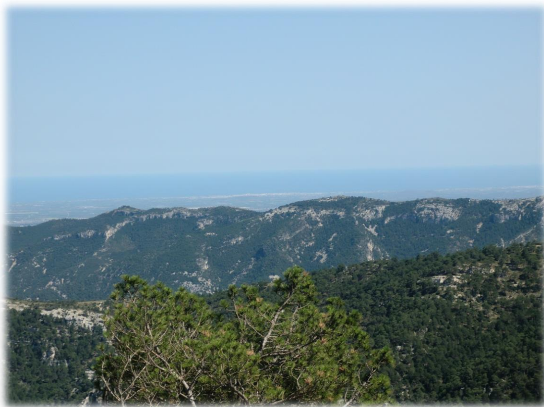
Vinaròs, Benicarló i Peníscola des de Fredes.

Fredes és el terme més septentrional del País Valencià. Simbòlicament, aquest indret és representat pel Tossal del rei o dels tres reis , situat a més de 1300 metres sobre el nivell del mar, el qual és el punt d'unió i on conflueixen dels tres regnes històrics de la Corona d'Aragó.