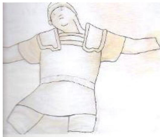
Restes d'un soldat sertorià esquarterat de cames i braços (Esquerra). Reconstrucció de la primera imatge (Dreta).