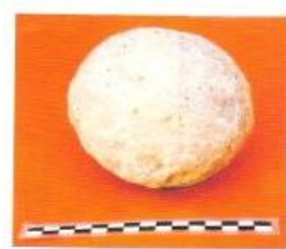
Projectil de ballista trobat a València. Alapont, Calvo i Ribera, pàg. 17.

Les fonts històriques ens parlen de la destrucció de la ciutat l'any 75 a.C. per Pompeu, com a conseqüència de la derrota en la batalla del Túria de les tropes sertorianes. Aquest suposat nivell de destrucció estudiat en l'Almoina ha donat una cronologia del primer quart del segle I a.C., d'entre els anys 80-70 a.C. 19