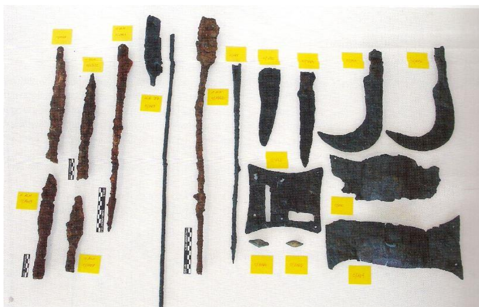
Restes d'armes romanes trobades a la ciutat de València. Alapont, Calvo i Ribera, pàg. 18.

Ens trobem davant d'un testimoni directe de la brutalitat i l'horror de la guerra social romana en la ciutat de Valentia . Un autèntic nivell de saqueig, destrucció i incendi. Els cossos que s'han trobat, presenten els membres dispersos, amb un gran nivell de violència: alguns d'ells decapitats i amb braços o cames amputades; altre cos presenta un empalament en vida 17 . Serà junt a aquestes restes humanes, on s'han trobat les restes armamentístiques mencionades, així com una gran quantitat de ceràmica (la majoria procedent de la Península Itàlica) i unes poques monedes 18 .