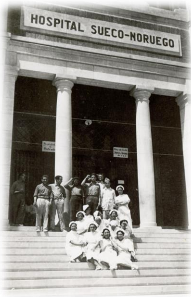
Grup d'infermeres i pacients.

En començar les gestions per a la posada en funcionament de l'hospital, el govern demanà l'ampliació de la capacitat de l'hospital, quelcom que suposaria més despeses i més personal sanitari. Per a la primera part, el Comité d'Ajuda Escandinau i el govern republicà arribarien a un acord, i per a la segona, l'escola d'infermeria de la Creu Roja d'Alacant convocaria a Alcoi un curs de capacitació sanitària, que pretenia preparar una plantilla de quinze "dames infermeres titulars", que s'incorporarien a l'hospital. 14