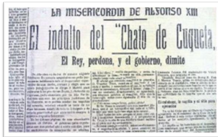
Notícia de l'indult del Xato de Cuqueta.

En conclusió, els Successos de Cullera són, a ben segur, un dels fets més destacats del moviment obrer al País Valencià. Aquest fet es deu, no sols a la truculència dels fets, sinó també a totes les causes, circumstàncies i conseqüències que es deriven dels fets. Però, la mostra de força que s'observa a Cullera no deixa de ser també un exemple de la dificultat del moviment obrer per a articular moviments de protesta coordinats i concertats amb altres nuclis poblacionals, com les protestes d'Alzira, Xàtiva o Carcaixent, que també actuen, al seu torn, de manera aïllada. Emperò, són precisament els punts forts i les carencies d'aquest episodi el que el fan molt interessant des d'un punt de vista historiogràfic, convertint-lo en un episodi cabdal i de citació obligada.