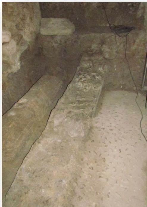
Alapont, Bañuls, Ferri, 2012. Detall de les restes de l'espina en l'Església de Sant Joan de l'Hospital.

Pel que respecta a la seva morfologia, era bastant gran, amb uns 350 metres de llarg per 70 d'ample. El circ es trobaria baix edificis com el de Comissions Obreres, l'església de Sant Joan de l'Hospital, l'Església de sant Felipe Neri i sant Tomàs o l'Hotel Palacio Marqués de Caro. De tots aquests edificis, l'únic que ha tret les seves restes a la llum són les de l'església de Sant Joan de l'Hospital, la qual es troba en el carrer Trinquet de Cavallers. A part de l'espina també s'han trobat restes de les grades, encara que el tros que es pot observar en baixar al subterrani on es troba l'espina no es veu; si que són visibles les grades en la plaça que es troba davant de l'església de Sant Tomàs i sant Felip Neri, concretament en l'antic restaurant Tunangalila. Les grades d'aquest circ formaria una espècie de muralla que coincidia amb els límits de la ciutat. L'espina concretament es troba al costat de la cripta de l'emperadriu Constança de Grècia.