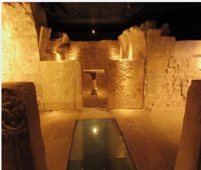
Ferri, Alapont; Bañuls, 2011. Nau central de la capella de Sant Vicent

servirien per a disposar la tomba. No va aparèixer cap ofrena funerària, en comparació amb les tombes localitzades a l'Almoïna. El material trobat indica que el monument hauria sigut construït cap a la meitat del segle VI.