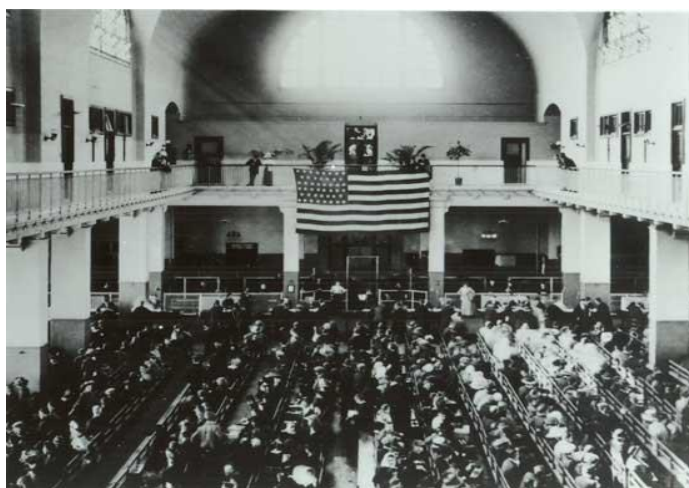
El gran saló.

Les condicions dels passatgers de tercera classe eren prou dures, si tenim en compte que els dormitoris comptaven amb lliteres de tres nivells on romanien la major part del temps, durant les dos setmanes que més o menys durava el viatge cap a Nova York. El fet de compartir habitació durant tants dies, provocà que es feren amistats amb aquells que compartien els mateixos costums i cultura 12 .