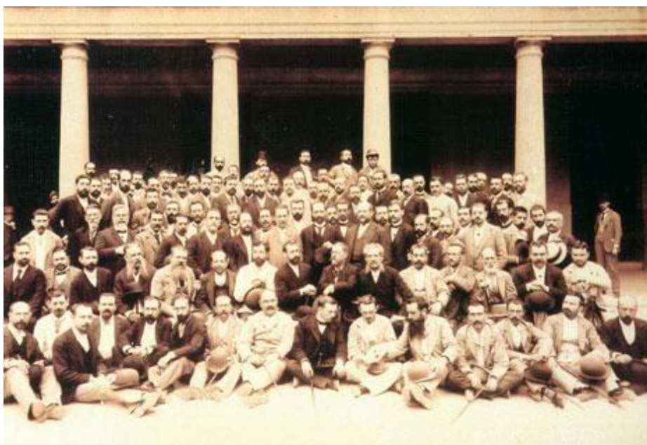
Participants del Primer Congreso Médico-farmacéutico Regional (26-31 de diciembre de 1891), una de las últimes activitats del Instituto Médico Valenciano .

En La Crónica Médica van aparéixer el 1888 dos dels seus articles i uns altres dos el 1889. La relació dels treballs va acabar amb la presentació de dos comunicacions al Congrés Medicofarmacèutic Regional de València . Una es va publicar el 1891 en la Crónica Médica , tot apareixent les dues en les Actas del Congreso publicades l'any 1894. Els seus treballs foren eminentment pràctics: tres dedicats a la vessant clínica, un d'anatomia patològica, un de fisiologia que es va publicar dues vegades i un altre d'estrabologia.