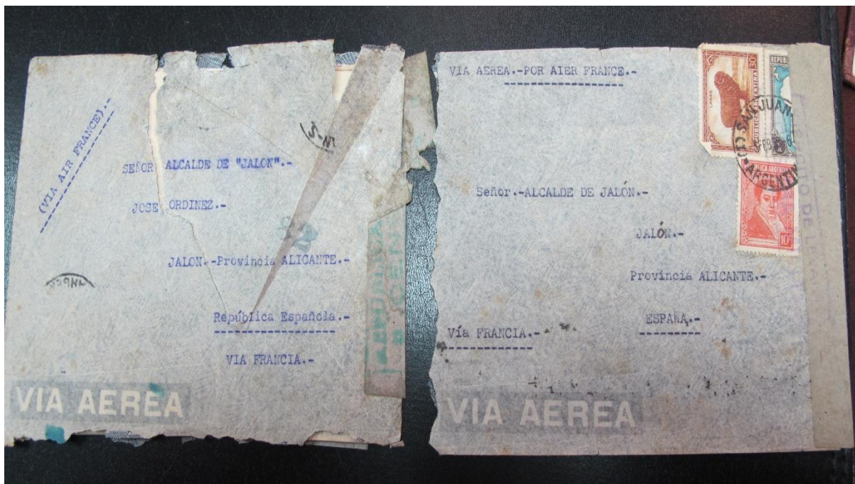
Fotografia de les dues cartes trobades en l'Ajuntament de Xaló procedents de San Juan (Argentina)

arribar gent de tota la Marina). Es tracta d'una zona rural que es va beneficiar dels coneixements agrícoles dels immigrants. Encara hui en dia es conreen oliveres, vinyes i altres cultius que els valencians van portar. Fins i tot es mantenen costums valencians com la paella dels diumenges, les falles, les festes patronals de Xaló o algunes cançons populars.